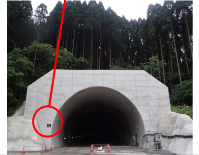
芳ノ元トンネル完成！！