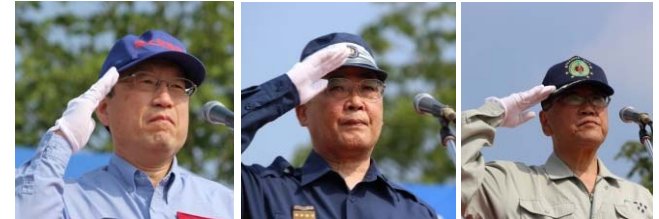
五十嵐水資源部長 中村長崎県知事 宮本諫早市長

日 時：平成29年5月14日（日） 8:50～12:30 場 所：本明川・福田川合流地点上流河川敷（長崎県諫早市八天町地先） 内 容：水防工法訓練、情報収集訓練、避難訓練、救出救護訓練、道路啓開訓練等 参加機関： 54機関