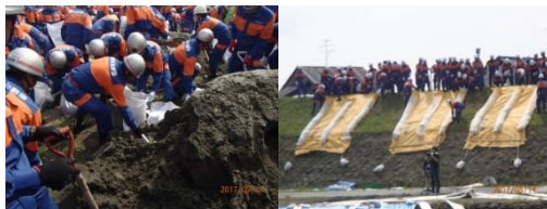
▲水防団による水防工法訓練▲