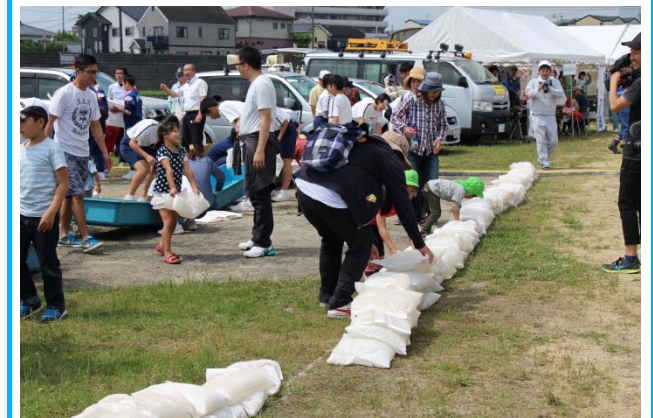
▲小学生・中学生も参加した水のうづくり