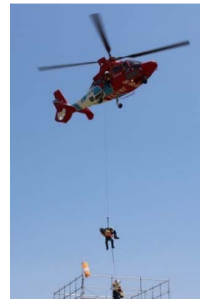
▲ヘリによる救助訓練