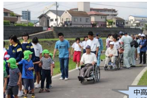
▲要配慮者による避難訓練