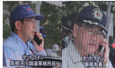
▲ Hotline 訓練 ▲