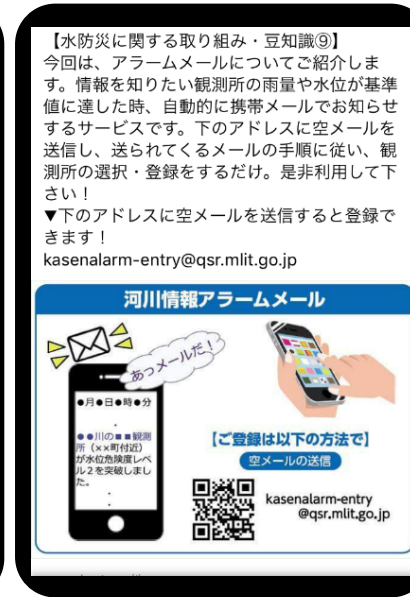
水防災に関する取り組み 豆知識⑨(H29.9.4)