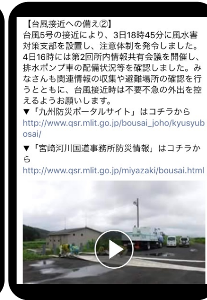
台風接近への備え② (H29.8.4)