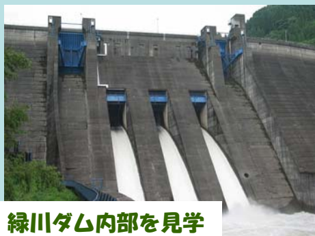
緑川ダム内部を見学