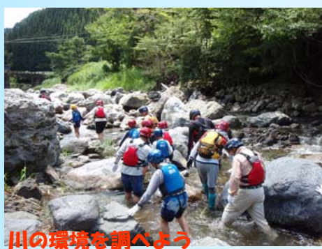
川の環境を調べよう