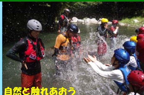
自然と触れあおう