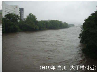
(H19年 白川 大甲橋付近)