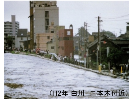
(H2年 白川 二本木付近)