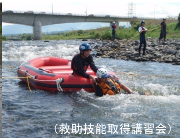
(救助技能取得講習会)