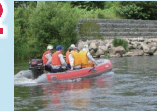
船による河岸の情報収集等