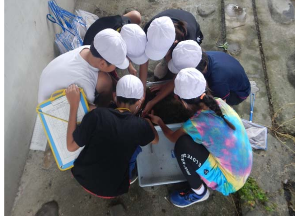
本明川 裏山橋 諫早小学校