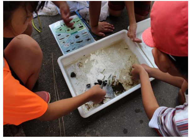
本明川 四面橋 諫早小学校