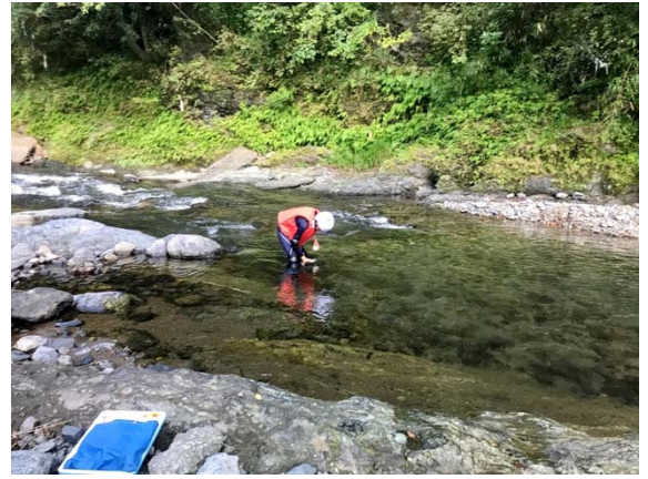
球磨川 油谷川合流前 直営