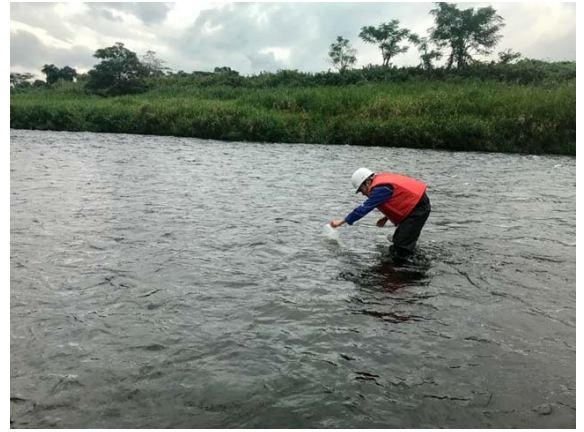
球磨川 球磨大橋上流 直営