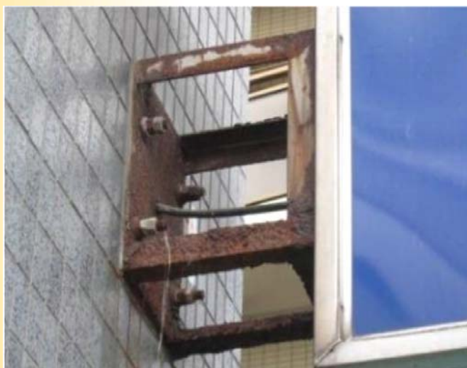
ブラケットの腐食による落下の危険のある看板