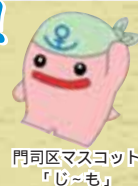
門司区マスコット「じ〜も」