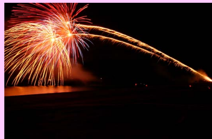
水中花火を含む700発の花火

当日は、冬らしい晴天に恵まれ、弦楽合奏コンサート、ハンドベル演奏、振舞い鍋、サンタさんのお菓子プレゼントをおこなった後、環境省快水浴場百選の海の部特選に九州で唯一選定された下阿蘇ビーチで、水中花火を含む700発の花火を打ち上げました。会場を訪れた約2,000人の来場者は、冬の澄んだ空気の中で打ち上がる花火に歓声をあげていました。