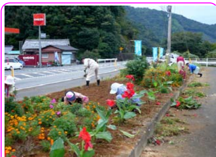
パートナーシップによる 沿道の花植え活動