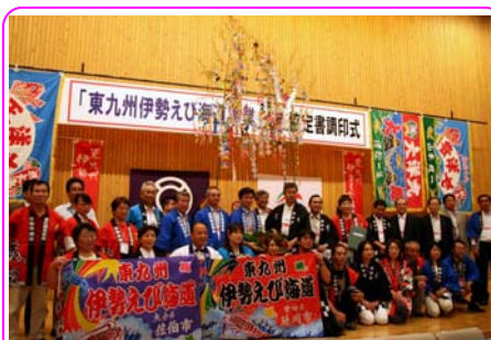
観光キャンペーンなどによる 県境を越えた地域連携