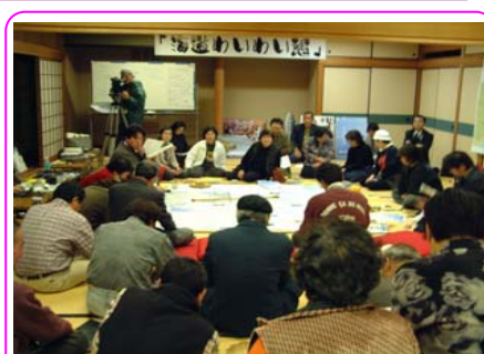
ワークショップの開催 による地域資源の発掘