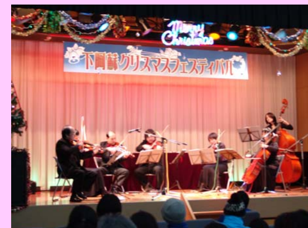
弦楽合奏コンサートの様子