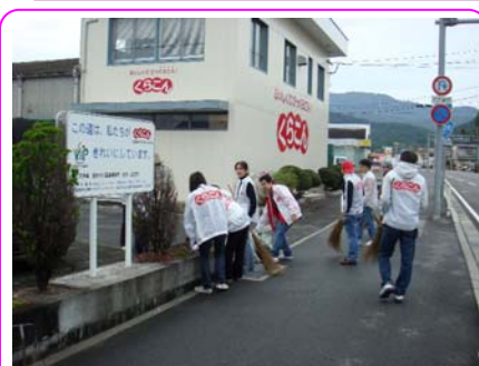
パートナーシップによる 沿道の清掃活動