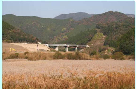
家田地区の湿原に広がるオギの穂と、建設中の東九州自動車道路（北川コース）