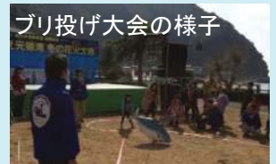
ブリ投げ大会の様子