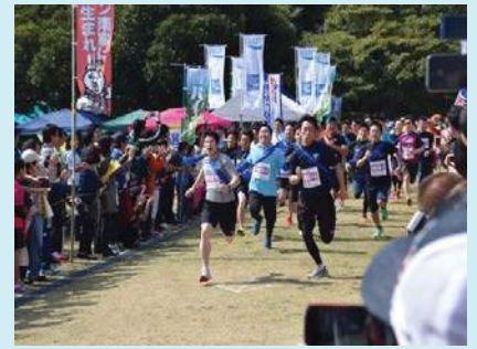
昨年(H27.3.21)開催時の様子 ゴール付近でのデッドヒート

開催日時:平成28年3月13日(日)10:00～14:30 場所:須美江家族旅行村(須美江ICから車で5分) (延岡市須美江町1450-2 TEL:0982-43-0201) (大会公式ホームページ: http://taikai.in/hkrm-nobeoka/ )