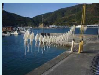
「モイカ」干しの風景

モイカは、冬のイカの王様で新鮮な刺身は肉厚で甘味が濃く美味しい一品です。また、一夜干しもあり、ご飯のおかずにも、お酒のつまみにおすすめです。