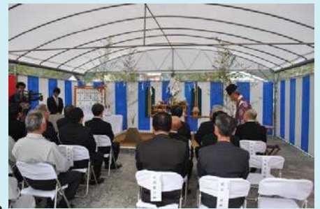
安全祈願祭の様子

ゴールデンウィーク前のオープンを目指し、工事が進められており、延岡市の新たな北の玄関口としての役割が期待されています！！