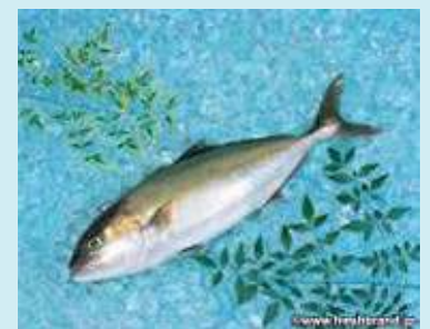
ほろ酔いカンパチ

通常捨ててしまう焼酎搾り粕の廃棄コスト、養殖コストの低減、さらに魚自体の付加価値向上など環境に優しく、大変美味しいお魚です！