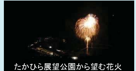
たかひら展望公園から望む花火

昨年はとても寒かったので防寒対策をしっかりと、冬の澄んだ空気の中で鮮やかにひらく花火を楽しんで下さい。