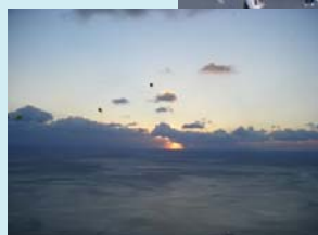
雲海から差し込む光