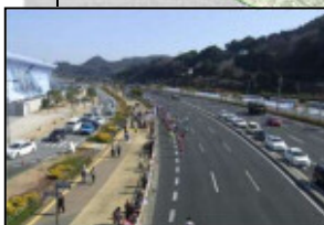
別大マラソンが行われる風光明媚な別大国道