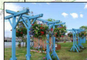
かんたん港園では各種イベント開催