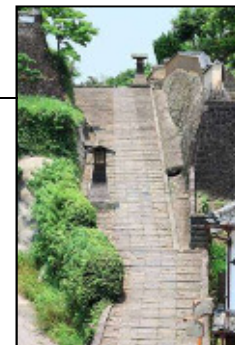
“坂道の町”と呼ばれる杵築