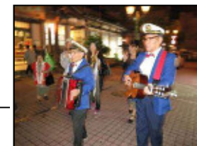
“流し”もあるまち歩き