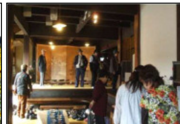
ギャラリー巡りが行われアートが盛ん。「涛音寮(とういんりょう)」と呼ばれる造り酒屋を改装したギャラリーもある。