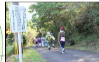
「ザビエルが歩いた道」など多数のウォーキングポイント