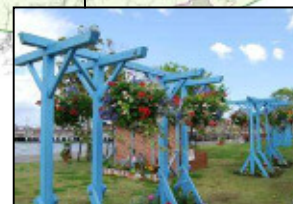
かんたん港園では各種イベント開催