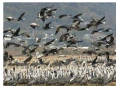
②鹿児島県のツル及びその渡来地