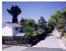
①出水市公開武家屋敷群