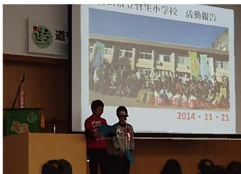
大分の子供たちによる活動報告