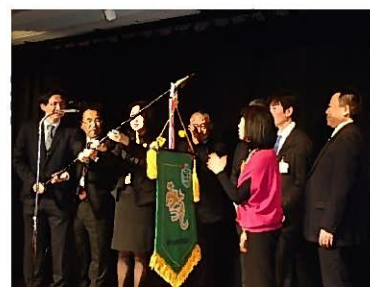
次年度開催の福岡へ大会旗が引き継がれました。早くも開催地(柳川)や日程の紹介がありました。