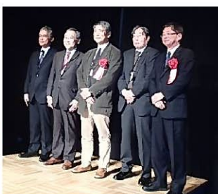
懇親会は歴代局長の出席もあり250人超の大懇親会となりました。