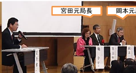
「道守・新たな地平をめざして」のテーマにより、対談が行われました。