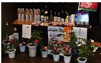
各県が趣向を凝らした恒例の「道守屋台」も賑わいをみせていました。かごしま会議の屋台もバラの花や焼酎で大変好評でした。