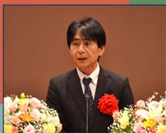
(小平田九州地方整備局長)