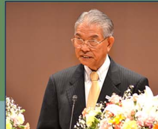
(薩摩川内市長 岩切 秀雄氏)