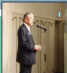
乾杯: 薩摩川内市長

交流集会も元気な薩摩っ子の「薩摩おどり太鼓」で幕を開け、大勢の会員による情報交換が行われました。各県紹介や恒例となった「道守屋台」も年々、趣向を凝らしたものになってきたと思われま