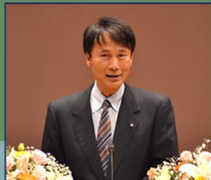
(鹿児島県知事 三反園 訓氏)