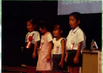
受賞者のみなさん