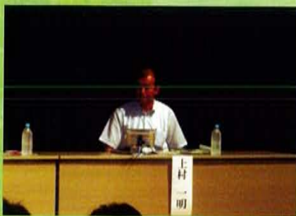
【鹿児島国道技術副所長】