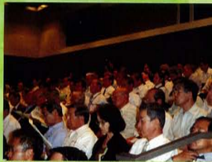
【熱心に話を視聴する参加者】