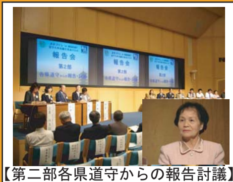
【第二部各県道守からの報告討議】