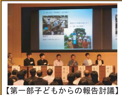
【第一部子どもからの報告討議】