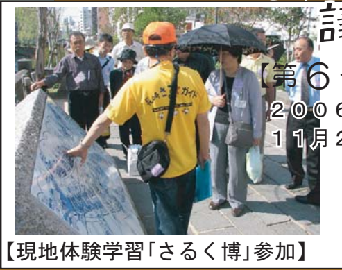
【現地体験学習「さるく博」参加】