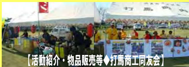
【活動紹介・物品販売等◆打馬商工同友会】