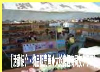
【活動紹介・物品販売等◆大垣農機協同組合】