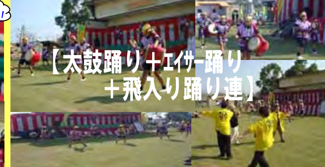
【太鼓踊り+エイサー踊り+飛入り踊り連】