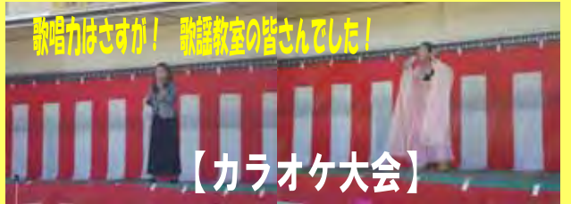
歌唱力はさすが! 歌謡教室の皆さんでした!