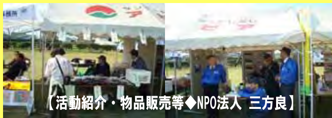
【活動紹介・物品販売等◆NPO法人 三方良】