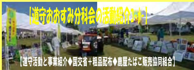
【道守活動と事業紹介◆国交省+粗品配布◆鹿屋たばこ販売協同組合】