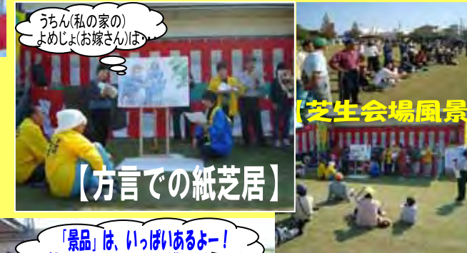
うちん(私の家の) よめじょ(お嫁さん)は...