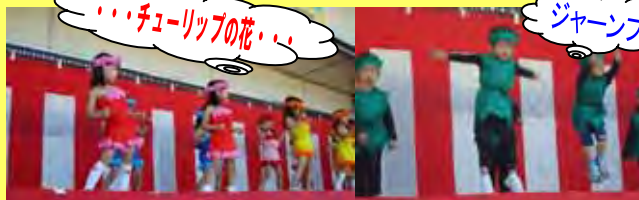
・・・チューリップの花・・・