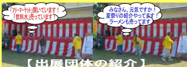
「フリマーケット」開いています! 「飲料水」売っています!