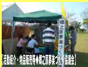
【活動紹介・物品販売等◆郷之原夢楽づくり協議会】