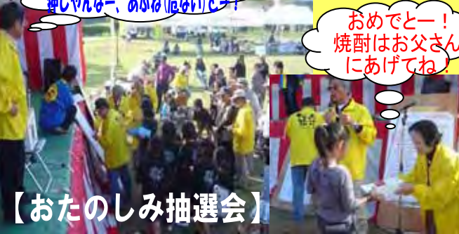
「景品」は、いっぱいあるよー! 押しやんなー、あぶね(危ない)とー!