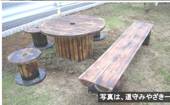
写真は、道守みやざき一斉活動（H20.10.26）時の活動状況です