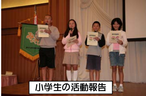
小学生の活動報告