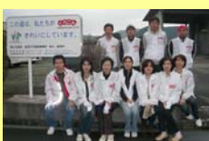
主に国道10号(延岡市稲葉崎)の歩道の清掃を行っています。