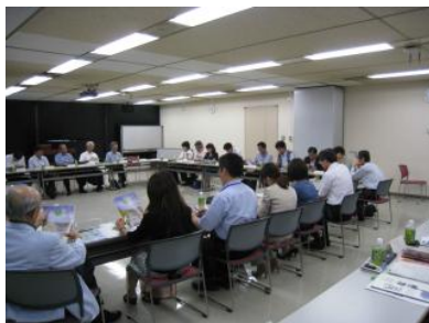
8.3 道守九州会議運営会議