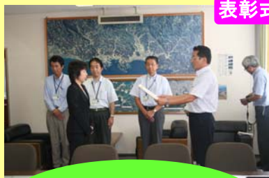
(株)くらこん九州工場 のみなさん