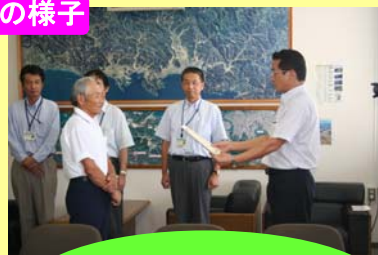
梶木地区環境美化推進 クラブのみなさん