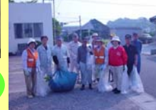
主に国道10号(日向市梶木)の歩道の清掃を行っています。

(※)「ボランティア・サポート・プログラム(VSP)」とは、地域や企業の皆さんに道路の美化清掃活動に参加していただき、道路管理者や市町村と共に快適な道づくりを進める活動です。