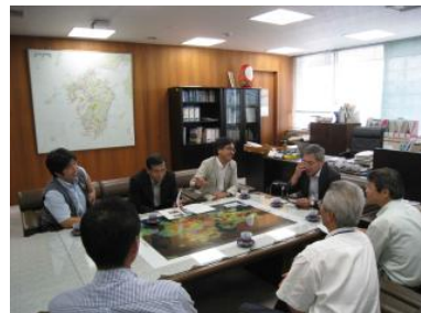
九州地方整備局長を訪問する「みちづくし宣伝隊」

「みちづくしinみやざき2009」の進捗状況については、「みちづくしinみやざき事務局」のブログをチェックしてみてください。開催までの日々の動きをブログでお知らせしています!!