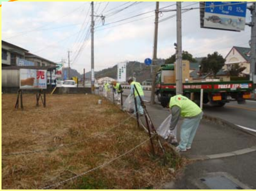
(有) クリエイトさん

県北みちもりの道守さんから活動報告です。 みなさまからの活動状況の報告をお待ちしております！！