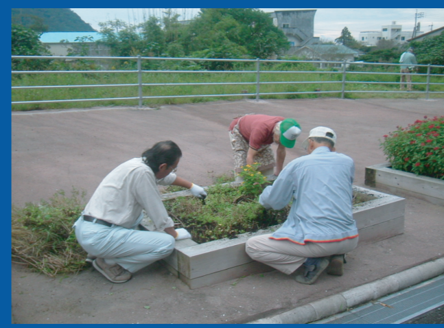
鶴戸山をかつしやる協議会の皆さん