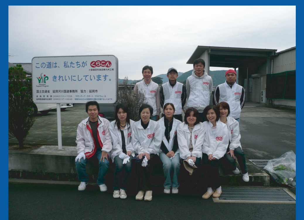
㈱クラコンの皆さん