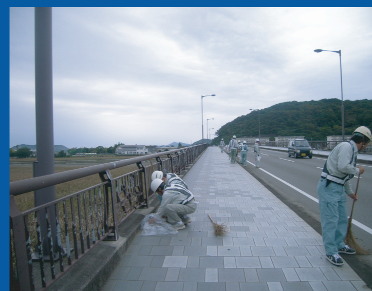
㈱内山建設の皆さん