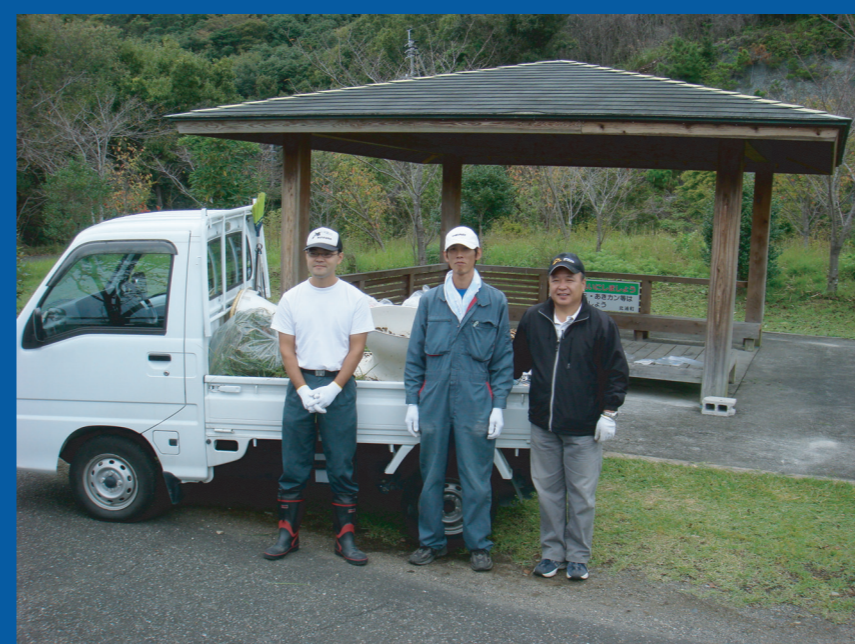
道の駅北浦の皆さん