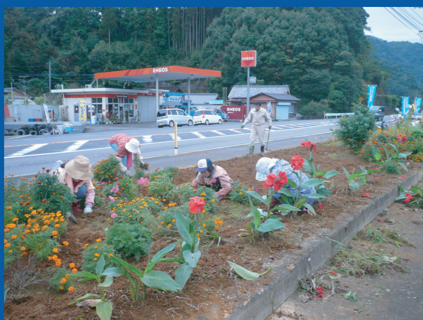
飛石花づくりボランティア会議の皆さん