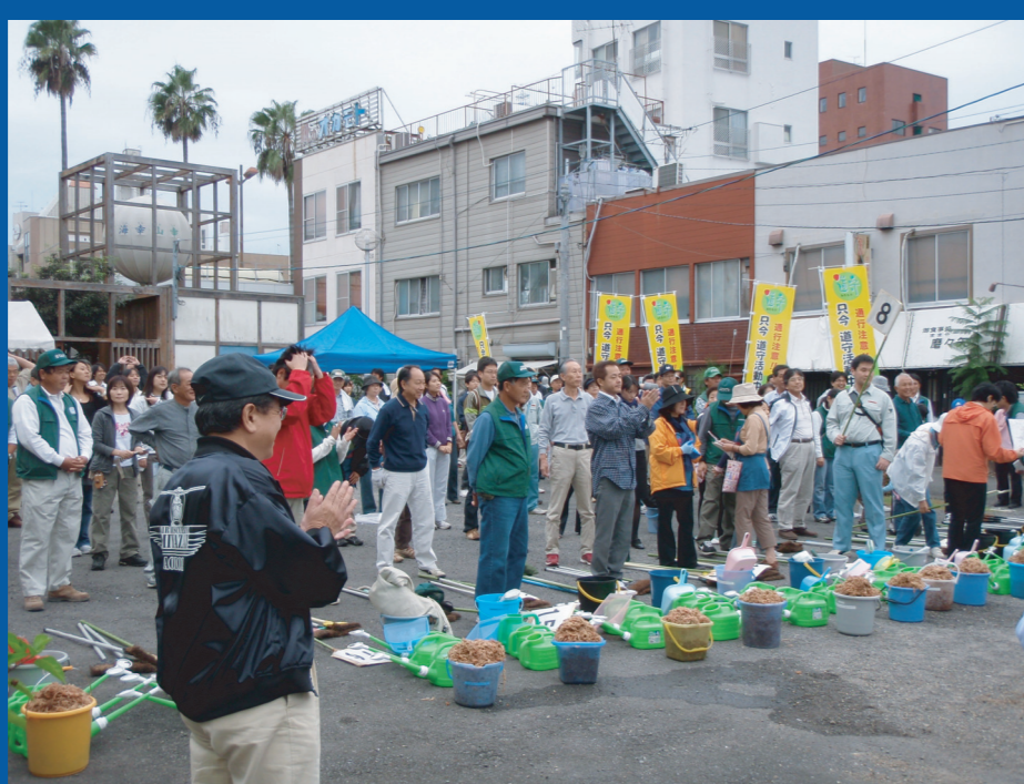
みやざきフラワーロードネットワークの皆さん