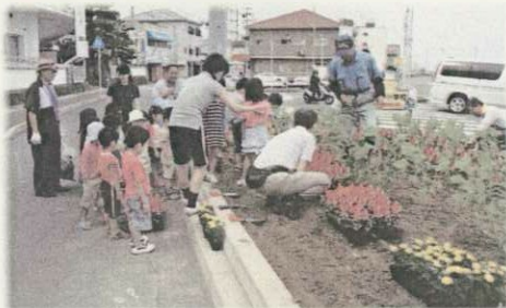
小浜温泉の玄関口が きれいになりました