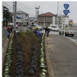
9日 葉牡丹植え付け