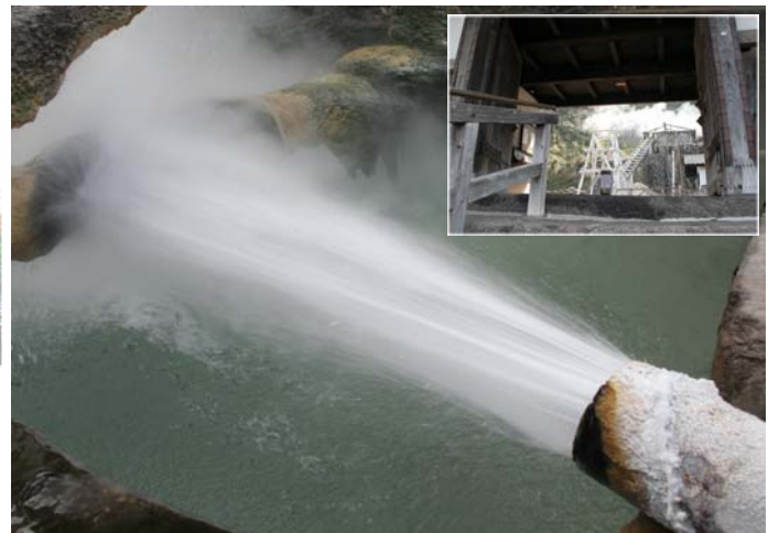
地底から噴出す100℃源泉 島原城から移築された門