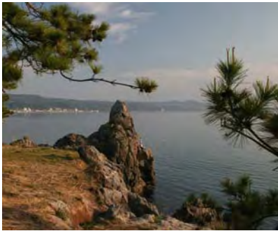
岬先端の巨岩の下に釣り人がいる 〈前方は小浜温泉街〉 周辺は絶好の釣り場である

岬の松林が鏡のような富津の入江を青緑に染める これまで地元の人々は松の苗を植え松林を守り育ててきた 富津の落日も夕日を誇る小浜温泉のなかでNo.1 弁天岬を映し出す落日の残像は思い出となることでしょう