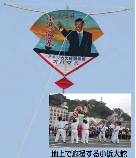
地上で応援する小浜大蛇