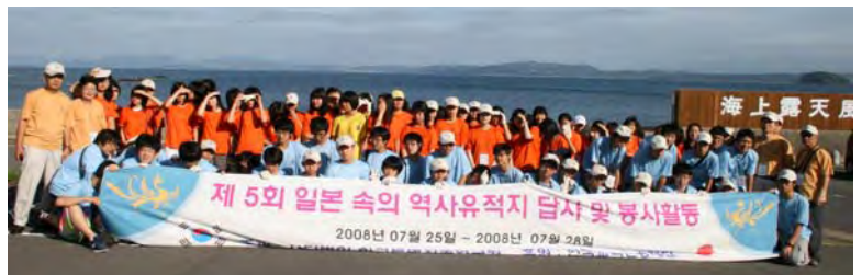
韓国の中学生・高校生環境美化活動