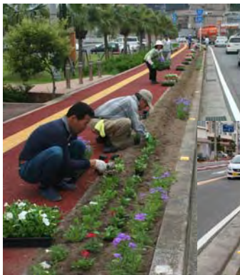
6.10 植え付けたパチュニア・ガーベラ