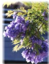
ジャカランダの花