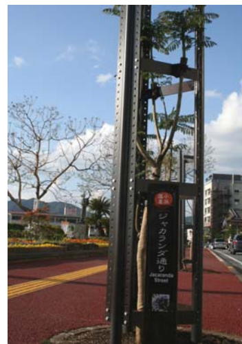
植栽された街路樹