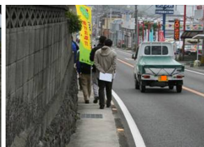
歩いてみれば 危ないですね