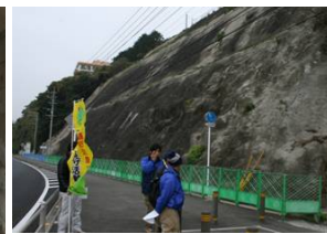
コンクリート吹き付けにクラックがあり強度等の調査が実施される