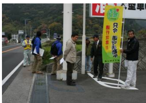
歩道設置について説明を受ける 早期完成が望まれている