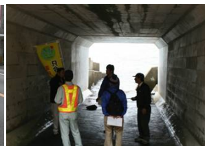
防火水利に利用されるボックスカルバート 鉄筋が一部腐食