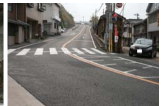
歩道も無い 見通しが悪い交差点 毎回 改良の要望が出る