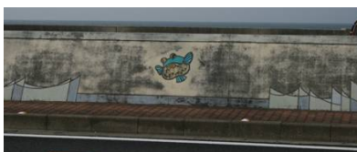
パラペットに描かれた魚の絵 ペンキが剥がれ見苦しくなっている