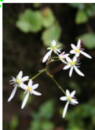
ダイヤモンドソウ (ウンゼンダイヤモンドソウ)

花は、大の字に見えることから大文字草と言うが、9月 雲仙の山にひっそりと咲いている。年、山に数十回登っていたが、ただ1ヶ所しか見られない。