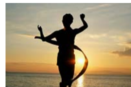
地点の目印「完走の華」