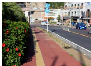
除草して、植え付け準備もOK！