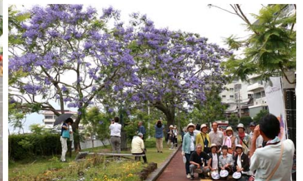
ジャカランダ通りは 記念撮影ラッシュ