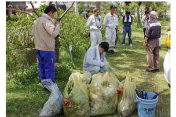
暑い中、お疲れさまでした!

人々を魅せる、紫の花ジャカランダ。6月、多くの観光客が小浜温泉を訪れます。街をきれいにしてお迎えしようと、国道57号の花壇の除草とジャカランダ通りを清掃しました。