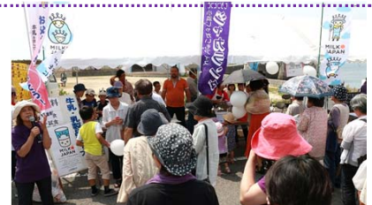
県外からの団体客も多く、会場は終日、大賑わい