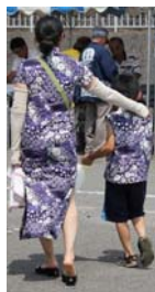
手づくり・手染めの衣装も