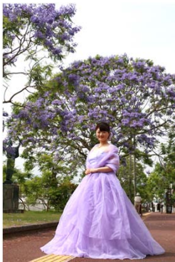
ジャカランダの花嫁