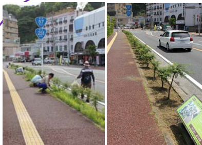
きれいになった花壇