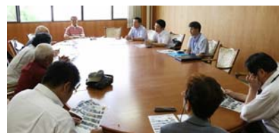
6月25日 意見・要望が続出