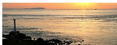
瀬詰崎展望台から潮流の眺望