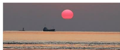
下げ潮 貨物船が外海へ