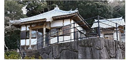
口之津歴史民俗資料館の赤い橋の手前から狭い道を200m上る