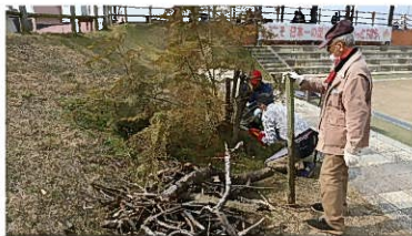
平成22年5月植樹 (市民寄贈)