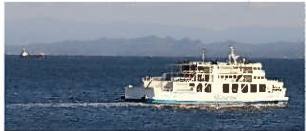
眼下を航行する島鉄フェリー