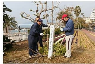
平成24年 小浜中卒業記念植樹