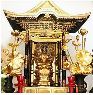
御本尊 十一面観世音

瀬高観音は霊松山潮音院と称し、本尊は「十一面観世音」座像は行基菩薩の作として有名。375年前、曹洞宗玉峰寺によって造営。現在の観音堂は、20年前に改築された。