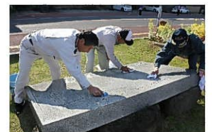
2013. 4月 足型を洗う

「小浜温泉57」環境美化&まちづくりのボランティア活動は 年会費1,000円で運営しています