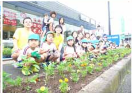
【地元の幼稚園児と一緒に花植え】