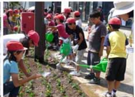
【丁寧に水をあげて作業は終了！】

この潮見小学校の活動を「地域をあげて支えていこう」と発足されたのが、『潮見小学校区町内連絡会』です。花植えの前に植栽帯の土作りを行ったり、花植えの日は作業を手伝ったり、一年を通して児童の活動をサポートして下さっています。