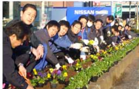
【ブルーステージ大塔の皆さん】

『ブルーステージ大塔』の皆様は、「地域の方とのふれあいと地域活性化に繋がれば」という想いから店舗の前の植栽帯への花植えを始められ、平成17年6月に「ボランティア長崎」を締結しました。店舗の前はいつも色とりどりの花が植えられ、ドライバーや道行く人の心を和ませてくれています。また、平成22年7月には新たな取り組みが始まりました。佐世保市が取り組んでいる「させぼ美化プロジェクト」で地元の幼稚園と連携し、園児が種から育ててくれた花苗を園児と一緒に植えたそうです。