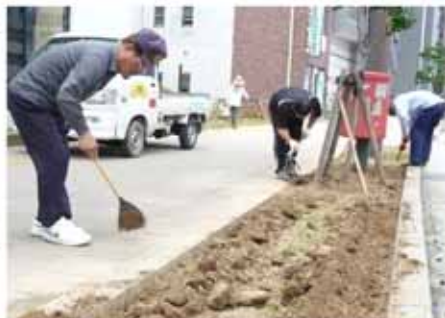
【固くなっていた土がふかふかになりました。】

6月9日、佐世保市立潮見小学校の児童が花植えを行いました。潮見小学校では、平成18年度より総合学習の一環として道路の美化・清掃に取り組んでいます。潮見小学校の児童が、種から大切に育てた手作り苗を、小学校前にある国道35号沿いの植栽帯に植えています。苗を植えた後も、水をまいたり、雑草を取ったりして、植栽帯をいつも美しく保っています。