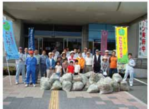
【最後に参加者の皆さんでパチリ。】