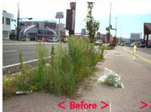
< Before >