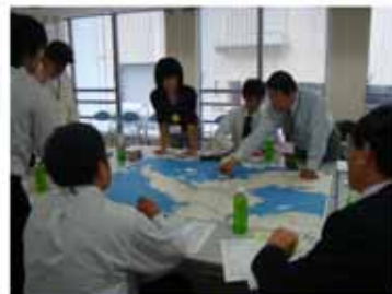
【長崎では周遊ルートを検討】