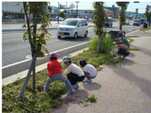
【生い茂っていた雑草がみるみるうちに刈り取られていきました。】

平成22年10月16日（土）、マイ・ツリー周辺の清掃・除草活動を実施しました。前回の清掃活動からちょうど半年が経ち、植栽帯には雑草が生い茂り、美しく整備された道路も見苦しい状態となっていました。今回の清掃活動には、マイ・ツリー会員の皆様はじめ多くの市民が参加して下さり、さわやかな秋空のもと参加者の皆さんがゴミ拾いや草取りに汗を流し、道路は見違えるほどきれいになりました。参加者からは、「雑草がなくなりスッキリしてよかった」、「いい汗をかいて気持ちいい」、「皆で活動すると楽しいので、今後も続けていきたい」等の感想が挙がっていました。