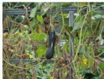
【栄養たっぷりの生ゴミリサイクル土で栽培された元気野菜（右）】