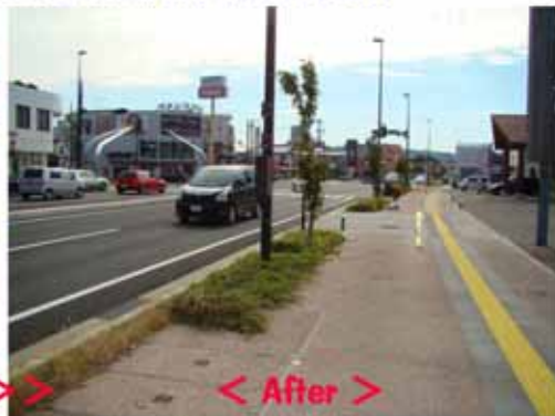
< After >