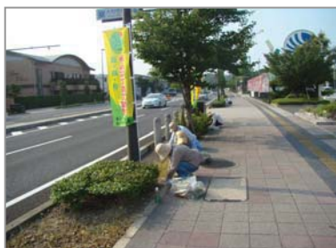
【清掃活動中のNPOクリーンマネジメント皆さん】

今後も定期的にマイツリー活動が実施されますので、お近くの方は是非、ご参加してください。