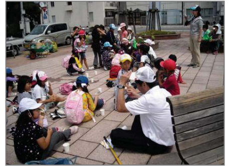
【暑い中、小学生もゴミ拾い頑張りました！！ 大変お疲れ様でした】