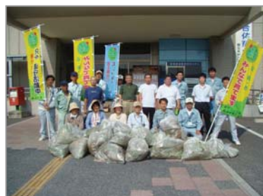
【雑草がいっぱいでした】