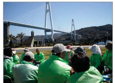
【大島の玄関口「大島大橋」をいつもきれいにしています】 【汗を流した後のお弁当は格別！ 大島大橋を見て食べるお弁当も格別！】