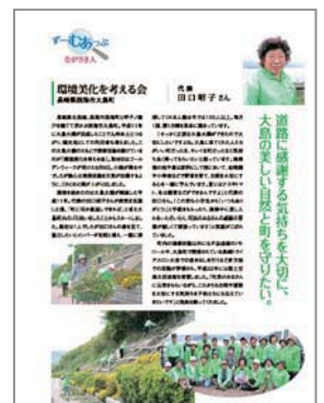
【DOVOC通信ながさき No. 14】