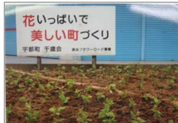
【子供たちとの花植えの様子です。きれいな花壇になりました】