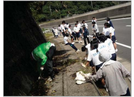
【高校生も炎天下の中、草刈り頑張りました！！ 大変お疲れ様でした】