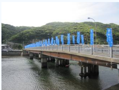
【雪川橋には旗が掲示】