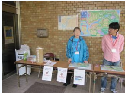
【(写真左より) 総合案内所には、通り名マップの販売や紹介(掲示)をされておりました】