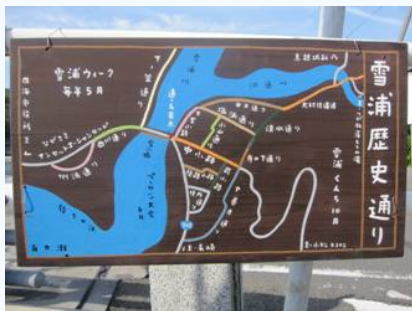
【手づくりの催し(パーロン大会6月)など 掲載され案内板です】