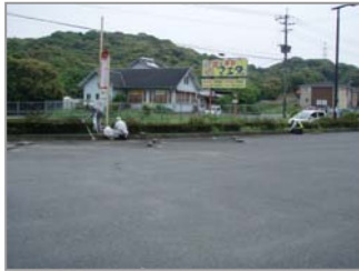
【(左) 作業状況 (右) 作業成果です】