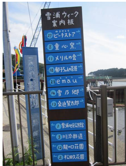
【雪川橋には大きな案内板が設置 来訪者には見やすく便利です】

「雪浦ウィーク」とは、 ~雪浦をこよなく愛し、またここに暮らし、またここで活動する人々によって行われます。海山川にめぐまれた自然豊かな雪浦を多くの人々に紹介し、雪浦での暮らし、生涯、創作、趣味の場を開放することによって、訪れる側、迎える側、双方が共に楽しめる、顔の見える交流をする催しです。 ~