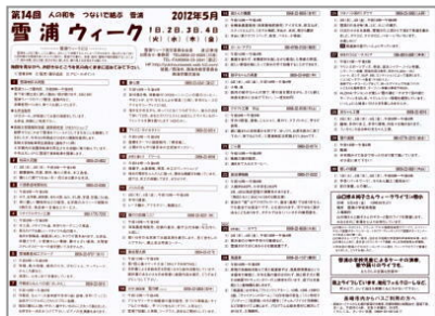
←裏面はお店の紹介で、 アピールポイントなど掲載