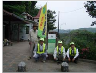
【NP0ながさきクリーンマネジメント皆さん & 大村維持出張所】