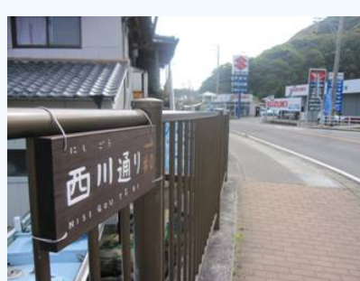
【現在も「通り名プレート」健全です】