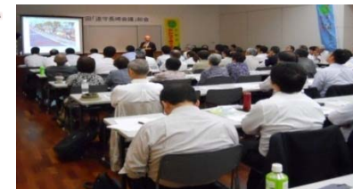
【昨年の総会の様子】

5月22日(金)に、第12回道守長崎会議総会を開催します。総会では、各地域で「道」をテーマに活躍している方が一堂に集まり、昨年度の活動報告、今年度の活動(案)などについて意見交換・情報交換をしますので、奮ってご参加下さい。