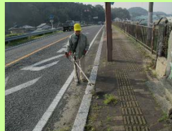
機械を使ってす～いすい