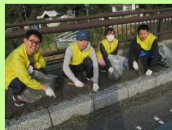
ここをほじってみんね