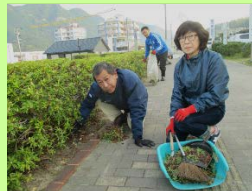
あ、ここにもあった！