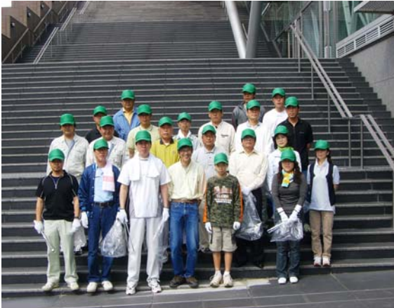
△クローバー・ロード清掃隊のみなさんです。