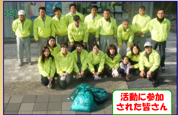
活動に参加された皆さん