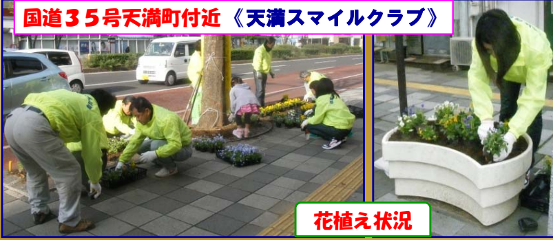
国道35号天満町付近 《天満スマイルクラブ》