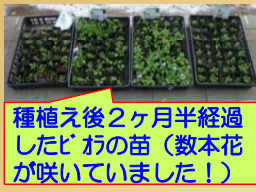
種植え後2ヶ月半経過したビオラの苗(数本花が咲いていました!)

9月中旬に種植えを行い、丹精込めて育てたビオラの苗も順調に育ち11月30日(水)、国道植栽帯に花植えを行いました。