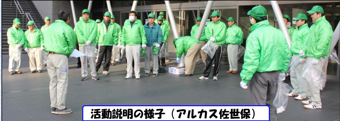
活動説明の様子（アルカス佐世保）