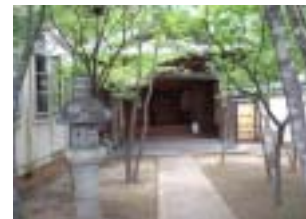
高橋記念館 潮聴閣