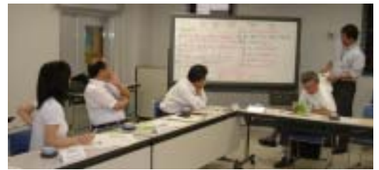
たくさんのキーワードから

古い建物や公園がたくさんある別府市では、八湯と言われる地域ごとにユニークな街づくりをしており、せっかく来ていただく皆様に別府の面白さを少しでも知っていただこうと、分散型の分科会を開きます。移動の時間や手配は大変で、ご迷惑をかけるかも知れませんが、ご協力よろしく申し上げます。