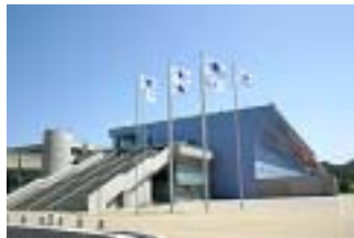
水族館「うみたまご」 高崎山おさる館会議室