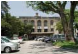
別府市中央公民館