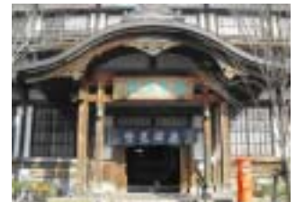
竹瓦温泉 二階会議室