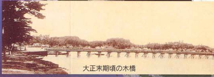
大正末期頃の木橋