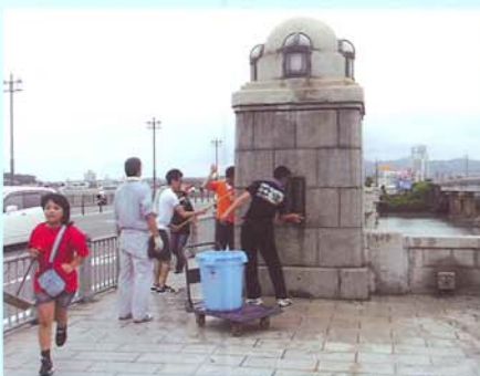
名島の誇りである名島橋をいつまでも美しく守りましょう。