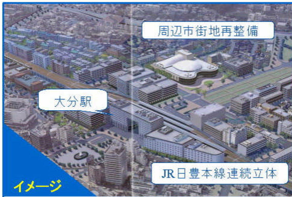
図 大分駅周辺市街地再整備イメージ図

暮らしの豊かさや魅力は地域によって異なることを認識し、長期的な視点に立って、地域の持つ個性を活かし、地域住民が誇りをもって暮らせるとともに、来訪者にも感動や共感をもたらすような、周辺の自然景観や地域文化と調和した、美しくて魅力にあふれるふるさととなる個性豊かな地域を目指す。