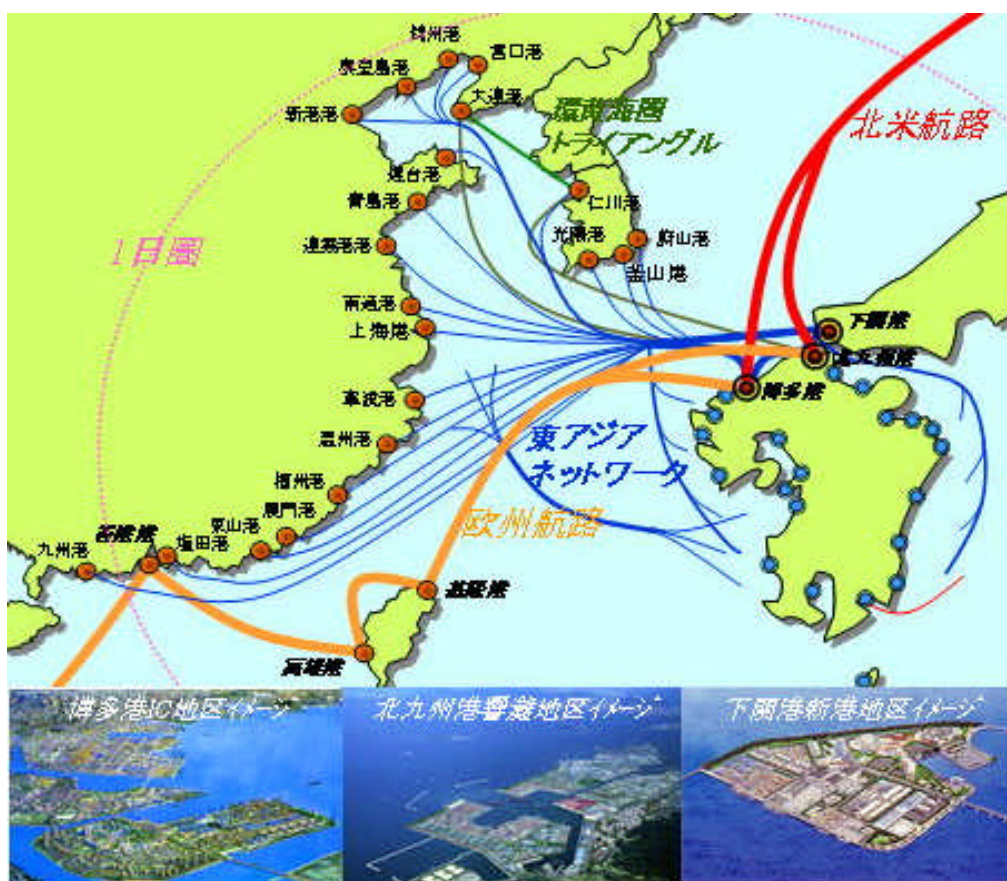
図 東アジア多頻度交流ネットワークイメージ

歴史的、地理的に東アジアとの繋がりが強い九州の交流範囲は、韓国との交流を基軸に中国東北部を含めた環日本海から、環黄海、台湾・香港に至る東アジア諸国へと拡大している。そして、東アジアを中心としてアメリカ、ヨーロッパなど世界各地との国際交流が深まっていく。九州は、このような様々な経済圏の核として東アジアとの一体的発展に向けた国際交流を先導する地域を目指していく。