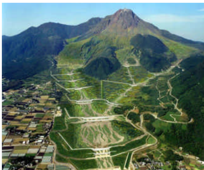
図 雲仙普賢岳・水無川の整備イメージ