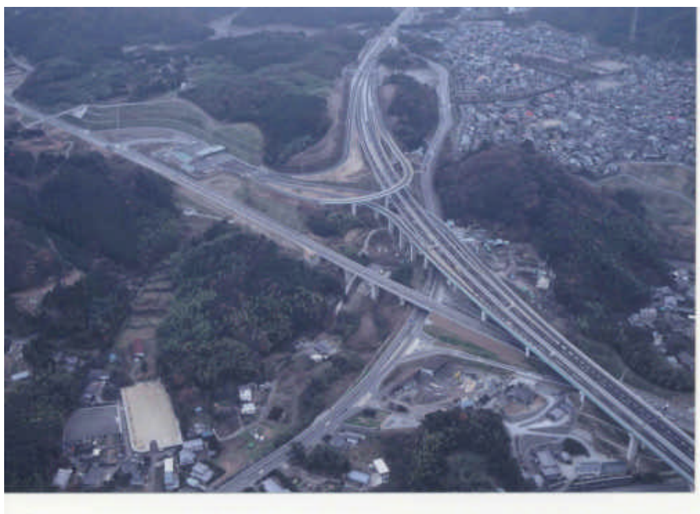
写真 東九州自動車道・宮河内インターチェンジ

そのため、これまでの中央指向を脱却し、地域自らが新たな発想を生み出し、九州が一体となって育てていける、チャレンジ精神にあふれてのびのびと活動できる地域を目指す。