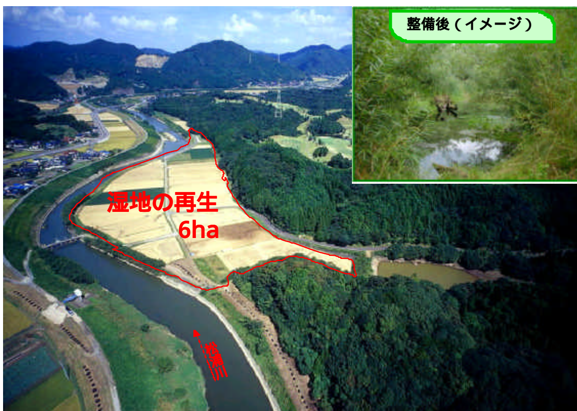
図 松浦川アザメの瀬整備イメージ

大量生産、大量消費時代に経験した公害問題を省み、地球規模で深刻化する環境問題に率先して取り組み、資源の有効利用を考えリサイクルに努めるなど、環境に負荷の少ない循環型の社会を目指す。