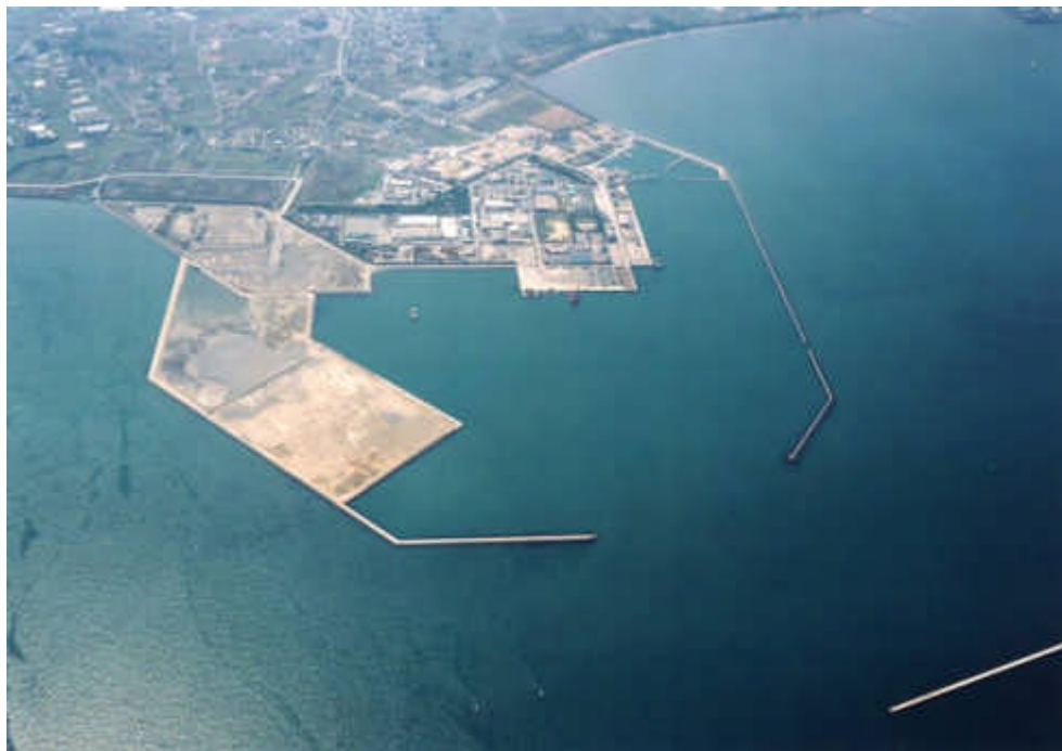
図 博多港アイランドシティイメージ