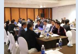
→ ハノイでの ビジネスマッチング