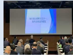
← JASMOC総会 の様子