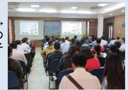
→ ハノイ土木大学での 就職説明会の様子