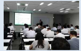
→ 東京会場での海外進出戦略セミナー