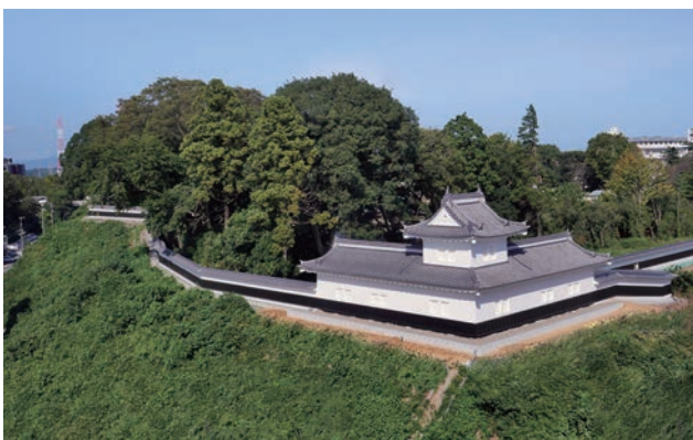
2021年6月に復元整備事業が完了した水戸城二の丸角櫓。