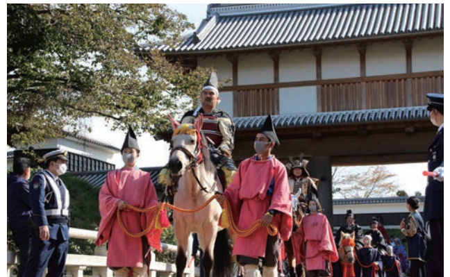
2020年2月に復元整備事業が完了した水戸城大手門。水戸東照宮の創建400年を記念した御祭禮行列が本地区内を練り歩いた。