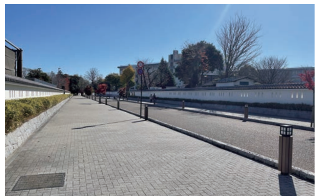
市立第二中学校前から杉山門方面に向かって見ます。学校施設の外構を白壁塀として整備を行った。