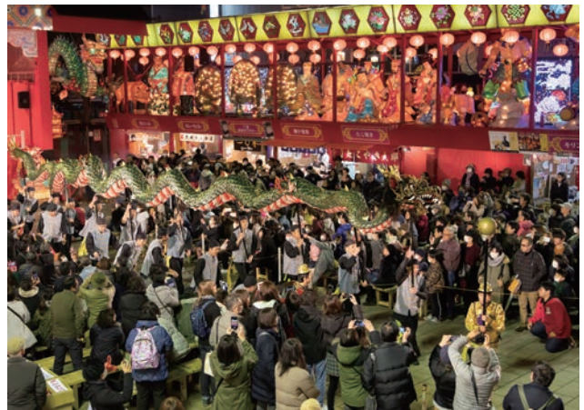
「ランタンフェスティバル」の様子。中国文化を表現した美しいあかりがまちなか全体にともり、毎年市民や観光客を含めた多くの来場者が訪れる。