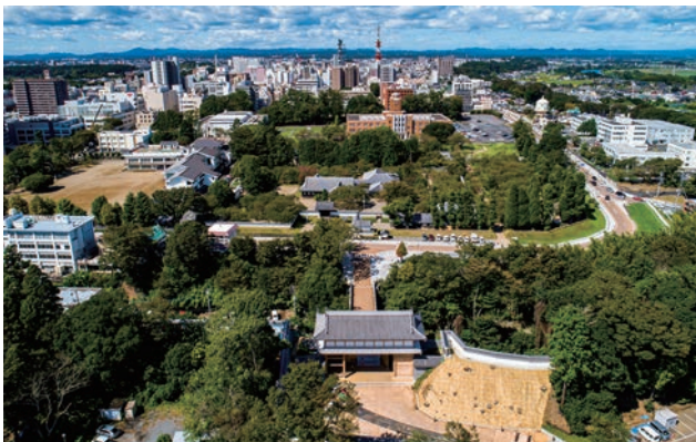
水戸城大手門背面（写真下）から弘道館・旧茨城県庁三の丸庁舎方面（写真中央～上）を望む。

市民の協力の下、面的な全体計画を立案、「象徴となる歴史的資源」を忠実に復元するとともに着実に周辺整備を行って城址の雰囲気を地区として醸成しており、「歴史まちづくり」の優れた事例であるといえる。今後、水戸駅や中心市街地との連携をさらに深めるとともに様々な市民活動がより一層活発に展開されることを期待し、特別賞を授与するものである。（岸井）