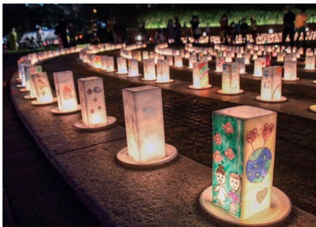
「平和の灯」の様子。子どもたちの手によってつくられた平和への願いや絵を書き入れた手作りのキャンドル3000～5000個があかりを灯す。

「平和の灯 ともしび 」(1993年～)、「ランタンフェスティバル」(1994年～)、「長崎夜市」(2007年～)、夜景プロモーション活動(2013年～)等の夜間景観地域活動と「ライトスケープ基本計画」(1993年)から「環長崎港夜間景観向上基本計画」(2017年)へと続く長崎市役所による夜間景観整備が、非核と世界平和への祈り、長崎大水害の鎮魂、夜景観光の振興、シビックプライドの醸成を目的として、約30年に渡ってお互いに連動しながら継続的に実行されてきた。その過程では地域の関係者が信頼関係を持って連携しながら、子ども達を始めとする多くの市民や来訪者が参加し、長崎のまちなかの歴史や文化を共有、顕在化させる夜景づくりの取り組みが積み重ねられてきた。その結果、長崎の夜景は平和のメッセージを広く発信するとともに、夜景観光の定着による地域経済振興のインフラとなり、市民自身が誇れるふるさとの景観となっている。