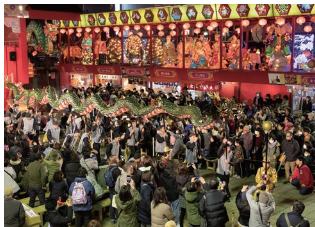
「ランタンフェスティバル」の様子。中国文化を表現した美しいあかりがまちなか全体にともり、毎年市民や観光客を含めた多くの来場者が訪れる。

このような夜間景観を中心に据えた公民連携のまちづくりの展開は、日本ではまだ事例が少なく、長崎での取り組みは極めて先駆的かつ独創的であり、景観デザイン技術の進展にも大きく寄与している。以上のことから、大賞にふさわしいと評価する。(卯月)