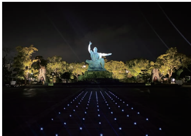
夜間景観整備によりライトアップをアップグレードした平和祈念像。右手(原爆)と左手(平和)を高機能スポットライトで照らしている。