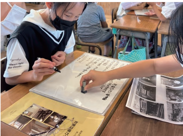
雁木のまち再生の方々から町家を一軒借りられることになったとき、どのように活用したらよいかを仲間と話し合う児童の様子。