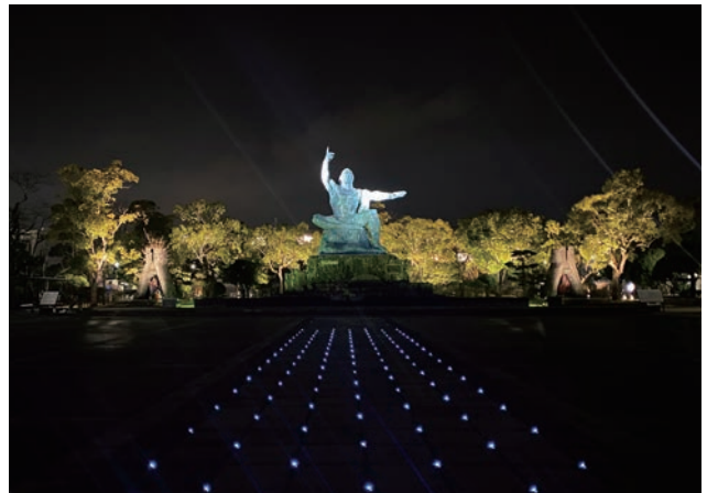
夜間景観整備によりライトアップをアップグレードした平和祈念像。右手(原爆)と左手(平和)を高機能スポットライトで照らしている。