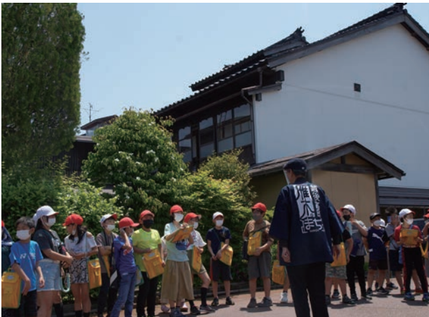
街歩きをしながら、高田の街の歴史や町家のつくりについて説明を受けている児童の様子。

10年前に受賞をした時の実績を基にしながらも、発展した教育実践が行われていることが評価され、優秀賞となった。(楚良)