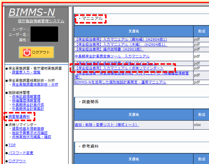
↑ BIMMS-N、■調査関連資料の画面より

官庁施設情報管理システム（通称：BIMMS-N）のメニュー「■調査関連資料」内の「・マニュアル」 「【保全担当者用】入カマニュアル<点検リマインダー>」（PDF）末巻に写真、図、解説を掲載しています。