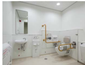
多機能トイレ（完成）