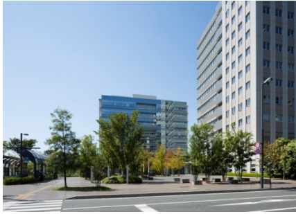
交流広場（手前：A棟、奥：B棟）