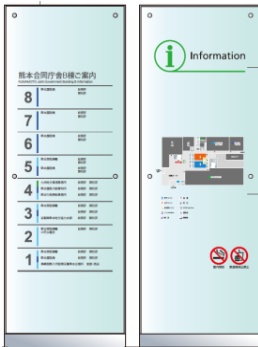
総合案内サイン（原案）