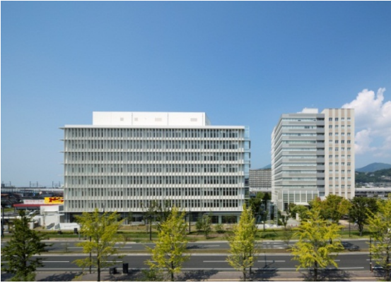
熊本地方合同庁舎A棟（右）とB棟（左）

1. はじめに 熊本地方合同庁舎は、施設の老朽、狭あい及び分散解消を目的として、熊本市内に点在する13官署を集約合同化する事業として、約24,000㎡の敷地にA棟（約26,000㎡、平成22年11月完成）及びB棟（約24,000㎡、平成26年9月完成）の2棟の建物を熊本駅周辺地域（熊本市西区春日2丁目）に整備しました。