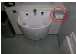
③紙巻器は右側に設置