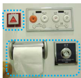
操作ボタン等（完成）