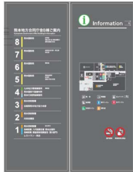
総合案内サイン（完成）