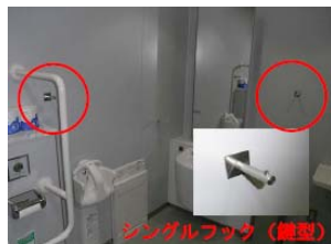
④シングルフックの増設