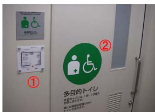
①トイレ入口の平面図表示 ②明るく入りやすいサイン