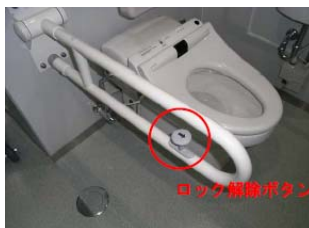
⑤ロック式の可動手すり