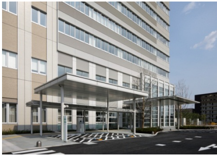
屋根付きの「障がい者等専用駐車場」