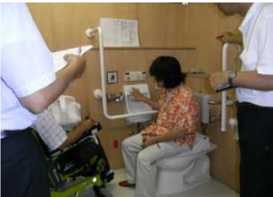
UDレビュー（モックアップの確認状況）

1. はじめに 熊本地方合同庁舎は、施設の老朽、狭あい及び分散解消を目的として、熊本市内に点在する13官署を集約合同化する事業として、約24,000㎡の敷地にA棟（約26,000㎡、平成22年11月完成）及びB棟（約24,000㎡、平成26年9月完成）の2棟の建物を熊本駅周辺地域（熊本市西区春日2丁目）に整備しました。