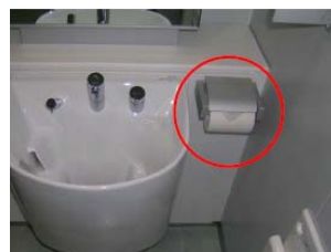
⑥金属製の紙巻き器