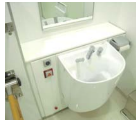
オストメイト（完成）