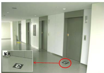
エレベーターホールの階数表示