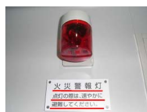
②火災警報灯の説明を表示