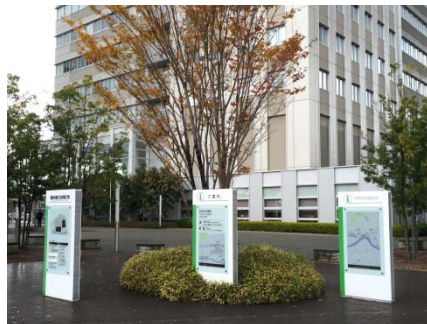
総合受付と案内サイン（B棟）